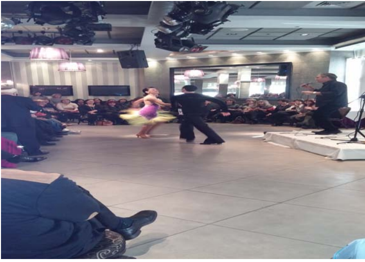
צמד רקדנים בחלק האומנותי ביום עיון ב"חוף התמרים", עכו