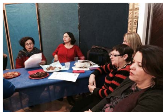
תמונות מערב שירה בציבור