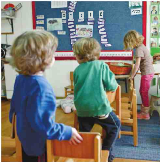
"למה הורים לא נאבקים על סיעת שנייה בגן"

"המורים לא ילמדו פחות, אבל יהיו פחות שעות הוראה פרונטליות בכיתה מול כל התלמידים. היום מורה מחויב ל-26 שעות הוראה ועשר שעות של למידה פרטנית ועבודה בבתי הספר, אבל כשמל"מדים כיתה של כמעט 40 תלמידים אי-אפשר להגיע לכולם. הילדים רק ירוויחו אם במקום הוראה פרונטלית הם יקבלו יותר שעות לימוד דים פרטניות. צריך לתת יותר יחס אישי לתלמידים".