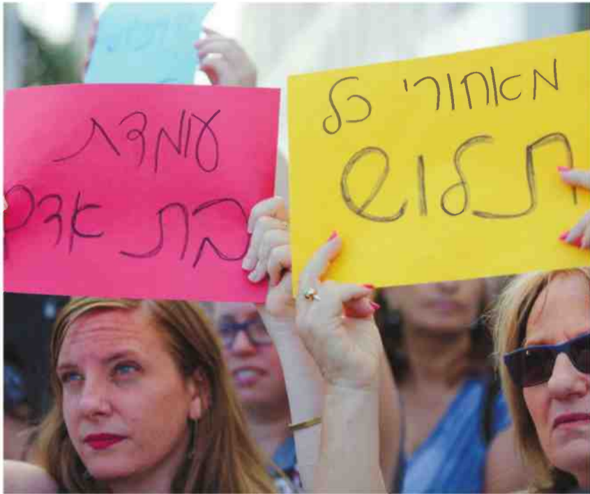
הפגנה של מורים בתל אביב